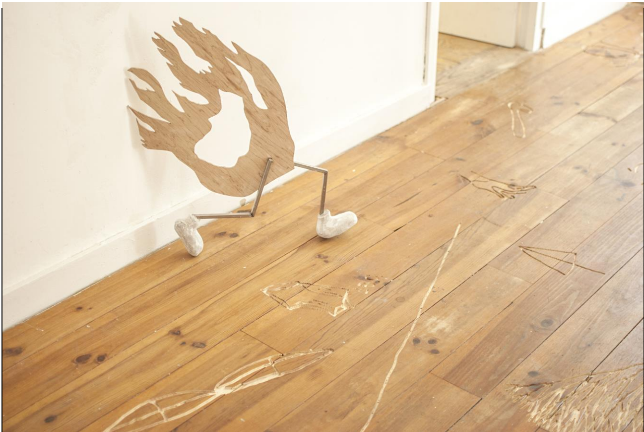
Mickey Yang, Lopend vuurtje, 2018 / Bodenarbeit von Timo van Grinsven