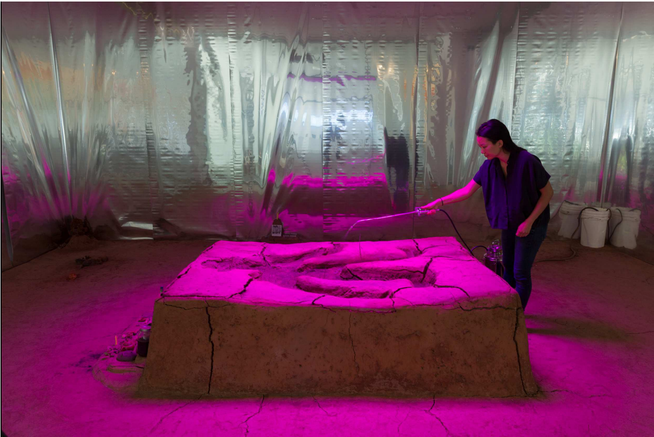
Candice Lin, La Charada China , The Hammer Museum, Los Angeles, 2018, Courtesy: Candice Lin, The Hammer Museum, François Ghebaly Gallery, Foto: Ian Byers-Gamber (KHO_Lin_01)